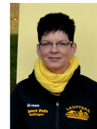
Martina Schaake NHC-Beauftragte